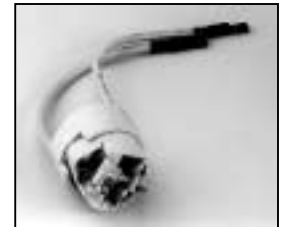
L4.73353.E Lamp holder Lampenfassung