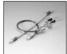
L4.82086.E Connecting wire compl. Verbindungslitzen kpl.