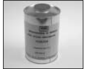
L4.70186.E Paint thinner Farb-Verdünnung