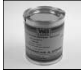
L4.70183.E Paint black similar RAL 9011 Lack schwarz ähnlich RAL 9011