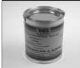
L4.70194.E Paint blue similar RAL 5015 Lack blau ähnlich RAL 5015