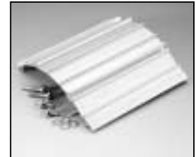
L4.82059.E Extrusion left Rippenblech links