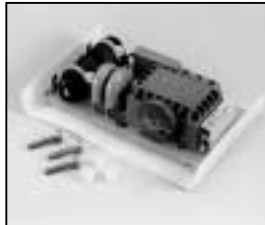
L4.82106.E Ignitor Zündgerät