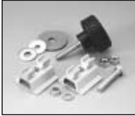
L4.79378.E Stirrup mounting-set Bügelbefestigungs-Set