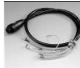
L4.82084.E Mains cable Scheinwerferkabel