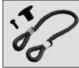
L4.79242.E Cable tie set Halteleine Set