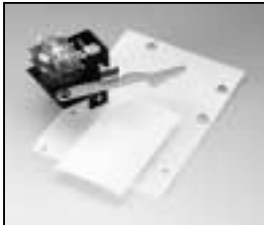
L4.82686.E Safety switch compl. Endschalter kpl.