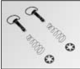
L4.83265.E Fast Look Schnellverschluss