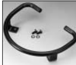
L4.82070.E Base skid Kufe