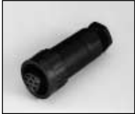
L4.73363.E Connector (Female) Stecker (Buchsenkontakt)