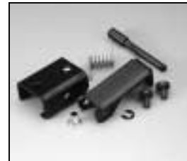
L4.82091.E Top latch compl. Torsicherung kpl.