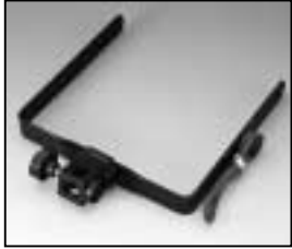
L4.82068.E Stirrup Haltebügel