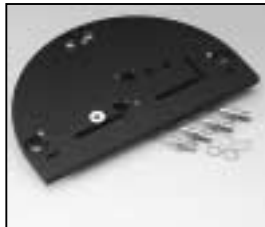
L4.82064.E Intermediate plate Zwischenplatte