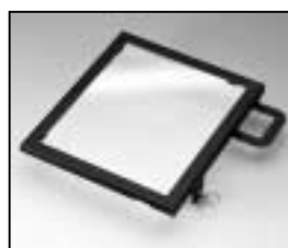
L4.82072.E Frame Rahmen