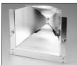
L4.82058.E Reflector Reflektor