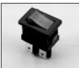
L4.77267.E On/Off switch Wippschalter