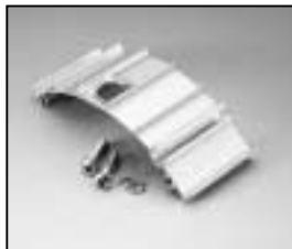
L4.82066.E Bottom extrusion left Rippenblech unten links