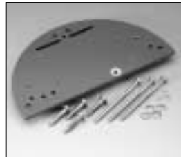
L4.82062.E Bottom plate Bodenplatte