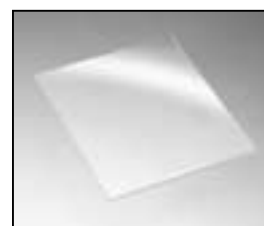
L4.82071XE Protective glass clear Schutzscheibe klar