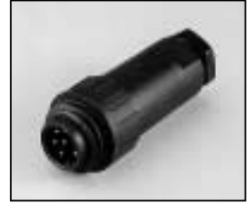
L4.73362.E Connector (Male) Stecker (Stiftkontakt)