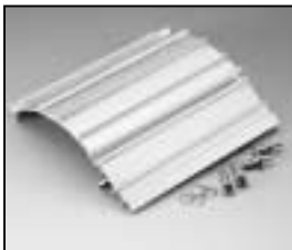
L4.82074.E Extrusion right Rippenblech rechts