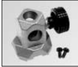
L4.79358.E 16 mm stirrup socket Hülse für Bügel