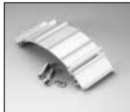
L4.82073.E Bottom extrusion right Rippenblech unten rechts