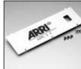
L4.82067.E Front plate Frontplatte